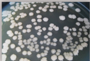
ลักษณะโคโลนี BS-DOA 24 บนอาหาร TSA endospore