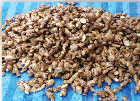
ผึ่งหัวพันธุ์ให้แห้งก่อนปลูก