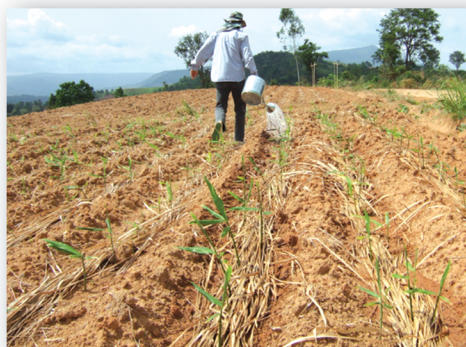
รดด้วยชีวภัณฑ์อัตรา 50 กรัมต่อน้ำ 20 ลิตร ทุก 30 วัน