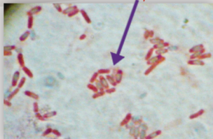
ลักษณะเอนโดสปอร์ ของ BS-DOA 24