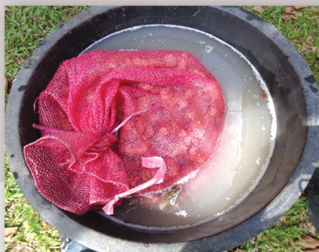
แช่หัวพันธุ์ก่อนปลูก